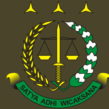
KEJAKSAAN TINGGI RIAU