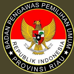
BAWASLU PROVINSI RIAU